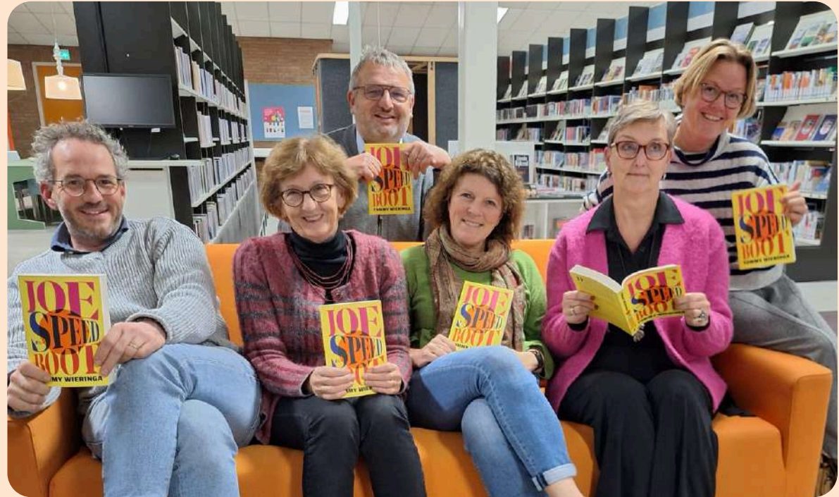
Raad van Toezicht 2024

De RvT heeft conform haar jaarrooster vijf keer vergaderd. Alle vergaderingen betroffen fysieke bijeenkomsten. Twee weken voorafgaand aan elke vergadering vond agendaoverleg plaats tussen de voorzitter van de RvT en de directeur-bestuurder.