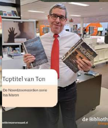
Toptitel van Ton

Een prachtig geschreven en aangrijpend verhaal over de krachten van liefde.